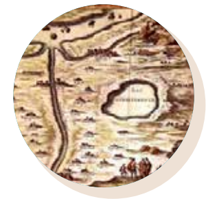
Gravure : la carte du Tendre telle que décrite par Mme de Scudery dans Clélie, une histoire Romaine (1654-1660)

Sous la forme d'une mise en scène chorégraphiée, teintée de cet imaginaire, de cette exigence musicale et littéraire, c'est là que je souhaite me rendre...